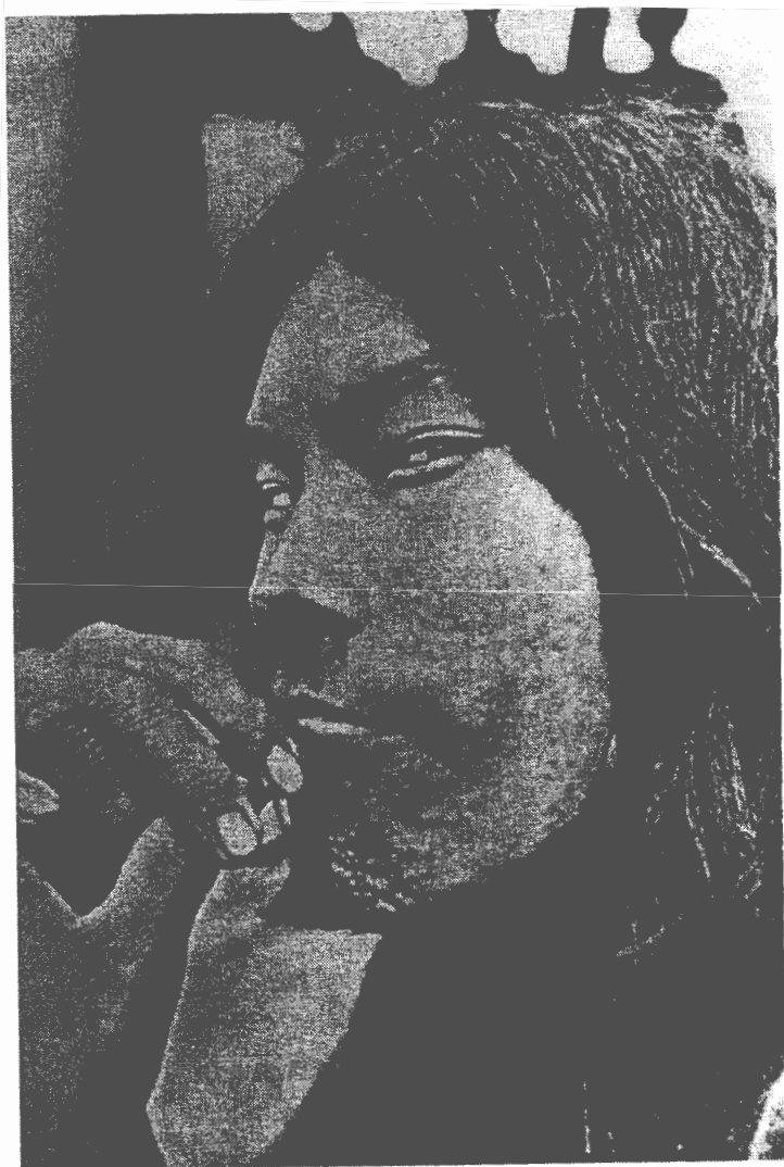
3. Retrato de un "campa del Gran Pajonal". La desconfianza del fotógrafo como del fotografiado es evidente en la imagen. Lámina 40.