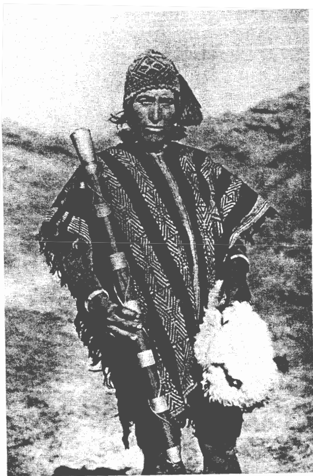
9. Retrato del "alcalde de Cqueros" una localidad en Puno. Nótese el cuidado de Kuczynski por registrar el vestido, la vara y la bolsa del personaje. De: Maxime Kuczynski, 1. Estudio familiar demográfico-ecológico en estancias indias de la altiplanicie del Titicaca ( Ichupampa ) 2. La condición social del indio y su insalubridad, miradas sociográficas del Cuzco 3. El Instituto Médico Higiénico Social del Sur, un proyecto organizador , Ministerio de Salud Pública y Asistencia Social, Lima, 1945, p.95.