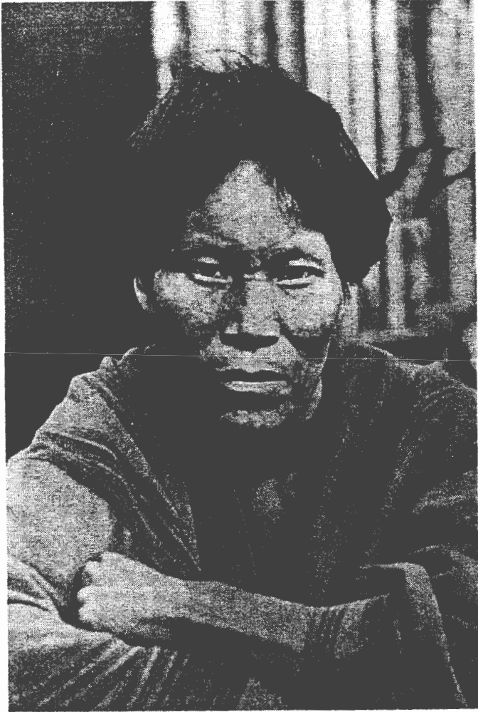
2. Fotografía de un "campa" de 45 años con el rostro marcado por la viruela (Las imágenes que presentamos aquí han sido tomadas por Kuczynski y aparecieron en el libro de Carlos Enrique Paz Soldán y Maxime Kuczynski Godard, La Selva peruana, sus pobladores y su colonización en seguridad sanitaria ( Editorial La Reforma Médica, Lima, 1939). Lámina 37.