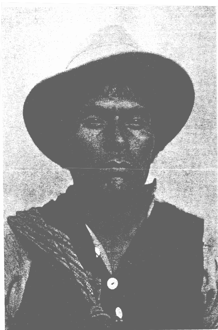
12. Según Kuczynski: "Indio de la región de Sandia, agricultor y lavador de oro". De: Estudios médico-sociales en las minas de Puno, con anotaciones sobre las migraciones indígenas (Lima Scheuch, 1945), p. 72.