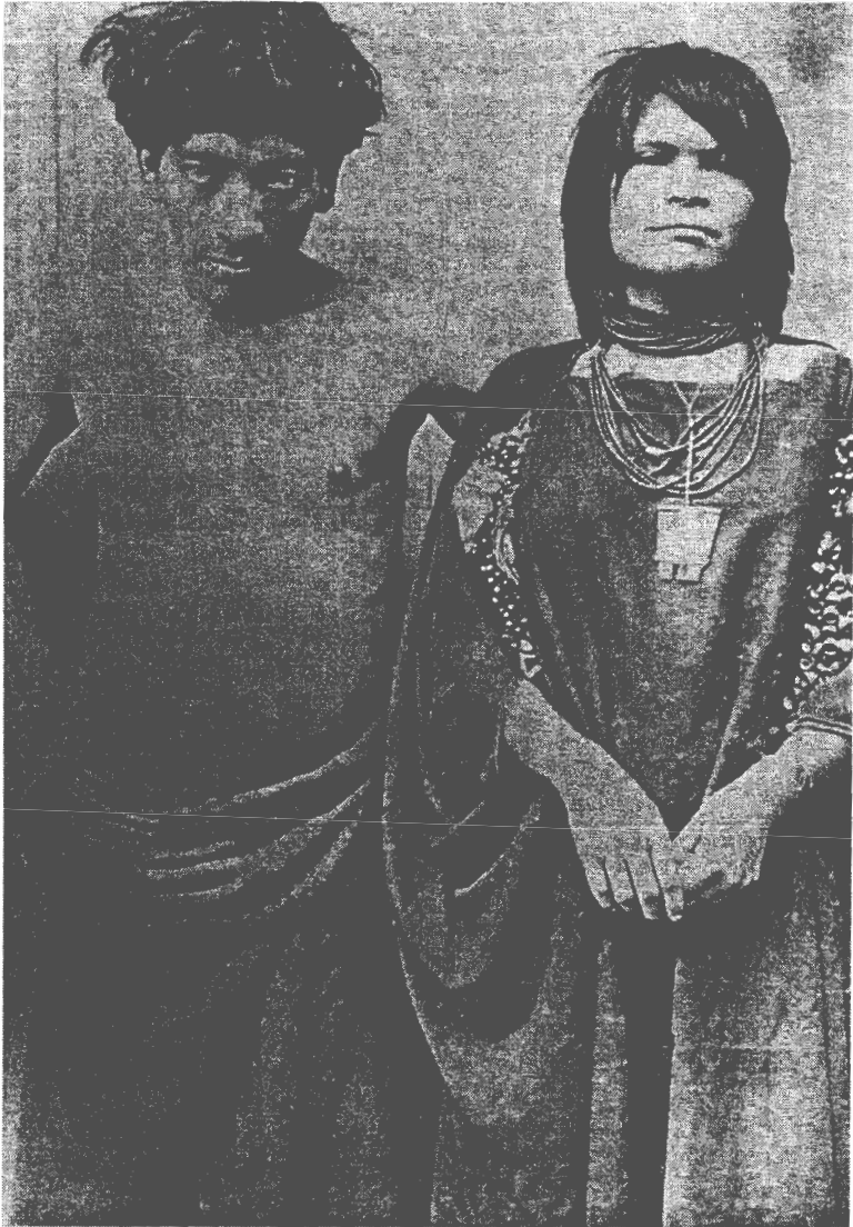
5. Fotografía de un matrimonio "campa". El hombre está enfermo de malaria "por su trabajo en las haciendas". Lámina 21.