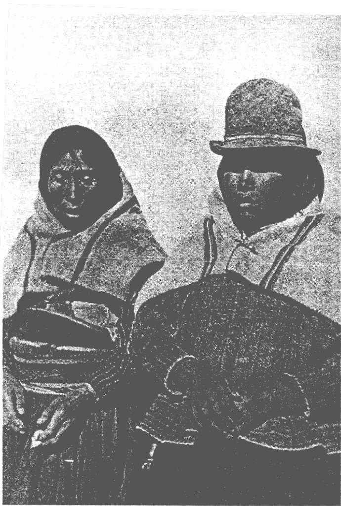
10. Según Kuczynski: "Mujeres, madre e hija, pastores de la región de San Antonio de Esquilache". De: Estudios Médico-sociales en las minas de Puno, con anotaciones sobre las migraciones indígenas (Lima Scheuch, 1945), p. 26.