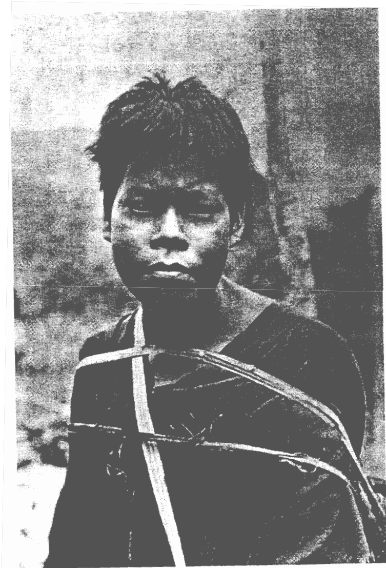
4. Fotografía de un "campa" con ceguera del ojo derecho "a consecuencia del mal de ojo", es decir, de la conjuntivitis producida por una "malnutrición profunda, de la carencia de la vitamina A". Lámina 69.